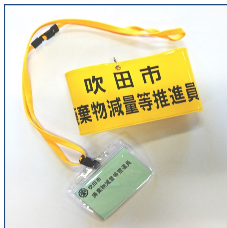
▲ 廃棄物減量等推進員の腕章と名札

廃棄物減量等推進員とは、市民と市をつなぐパイプ役として、また地域での活動のリーダーとして、市とともに持続可能な循環型社会の構築を目指して活動いただく制度です。各地区連合自治会長からの推薦を受け、市長が委嘱します。