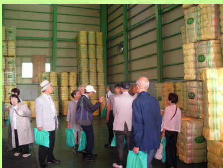
綺麗に梱包された古着類 (有)高島産業

我々が古着として出している布製品が約80種類に分別されて海外に送られて活用されていることは我々が地球の資源と環境に貢献しているということ