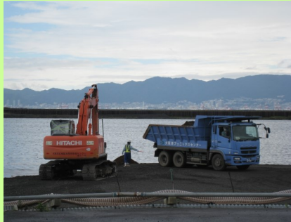
埋立作業のようす