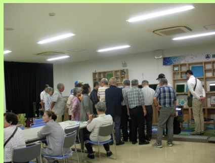
リサイクルされたガラス製品の見学 (藤野興業株)

我々が古着として出している布製品が約80種類に分別されて海外に送られて活用されていることは我々が地球の資源と環境に貢献しているということ