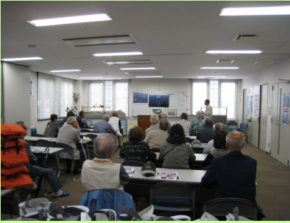
フェニックス概略の説明を受ける