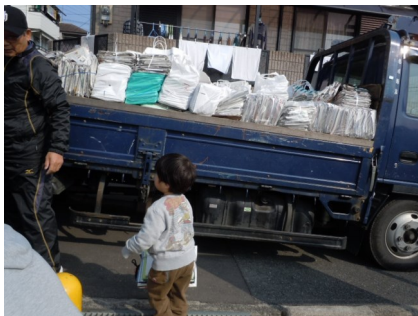
虹ます子供会の集団回収の様子

平成28年(2016年)2月28日(日)片山地区虹ます子供会で再生資源集団回収が行われました。資源物の排出だけでなく、トラックまで運んだり、積込みを手伝ったりと小さいお子さんから年配の方まで地域一丸となり取り組んでいただいています。再生資源集団回収はごみの減量のみならず、地域のコミュニティの活性化にも役立ちます。また、再生資源集団回収に取り組んでいる団体には市から1kgあたり7円の報償金が支給されます。是非、再生資源集団回収に御協力いただきますようお願いいたします。