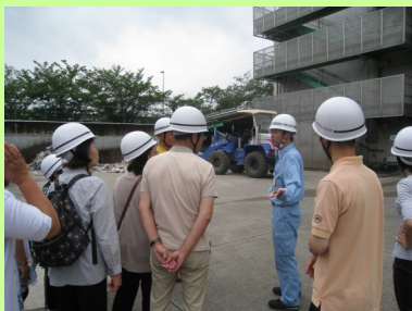
小型複雑ごみの選別作業の見学