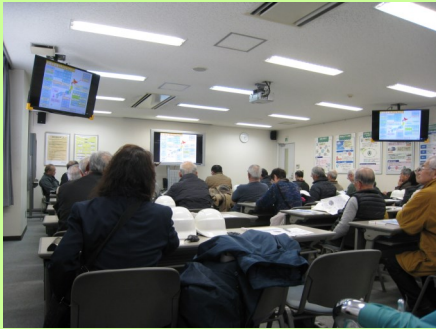
家電リサイクルについての説明を受ける