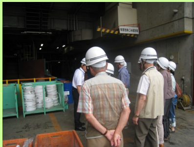
有害危険ごみの選別作業を見学

分別作業を人の手で行なっていることにびっくりした。手間を惜しまず分別するようにしたい