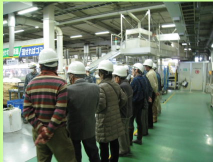
洗濯機の手分解作業の見学

興味があったので大変勉強になったが、家庭用のみでなく、業務用も処理する必要があると思う