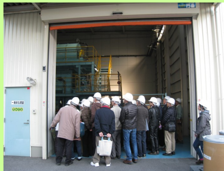
廃蛍光管の一次処理の説明を受ける

蛍光灯の水銀を取り除いた後のガラス、カレットが住宅用の断熱材やセメントの原料となっており、セメントにガラスが入っているとは思わなかった