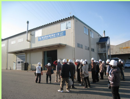
搬入された廃蛍光管、廃乾電池の一時保管庫の見学

蛍光灯がすべてリサイクルされているとは知らなかった。 作業人数が少なく、機械化が進んでいることにも感心した