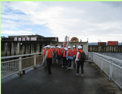
埋立場に到着し、見学

埋立は、廃棄物をそのまま埋めていると思っていたが、いろいろな処理をしていたので大変な作業だと思った