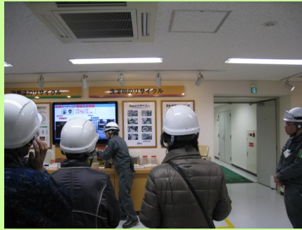
品目ごとのリサイクルの説明を受ける