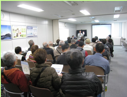
廃蛍光管のリサイクルの説明を受ける