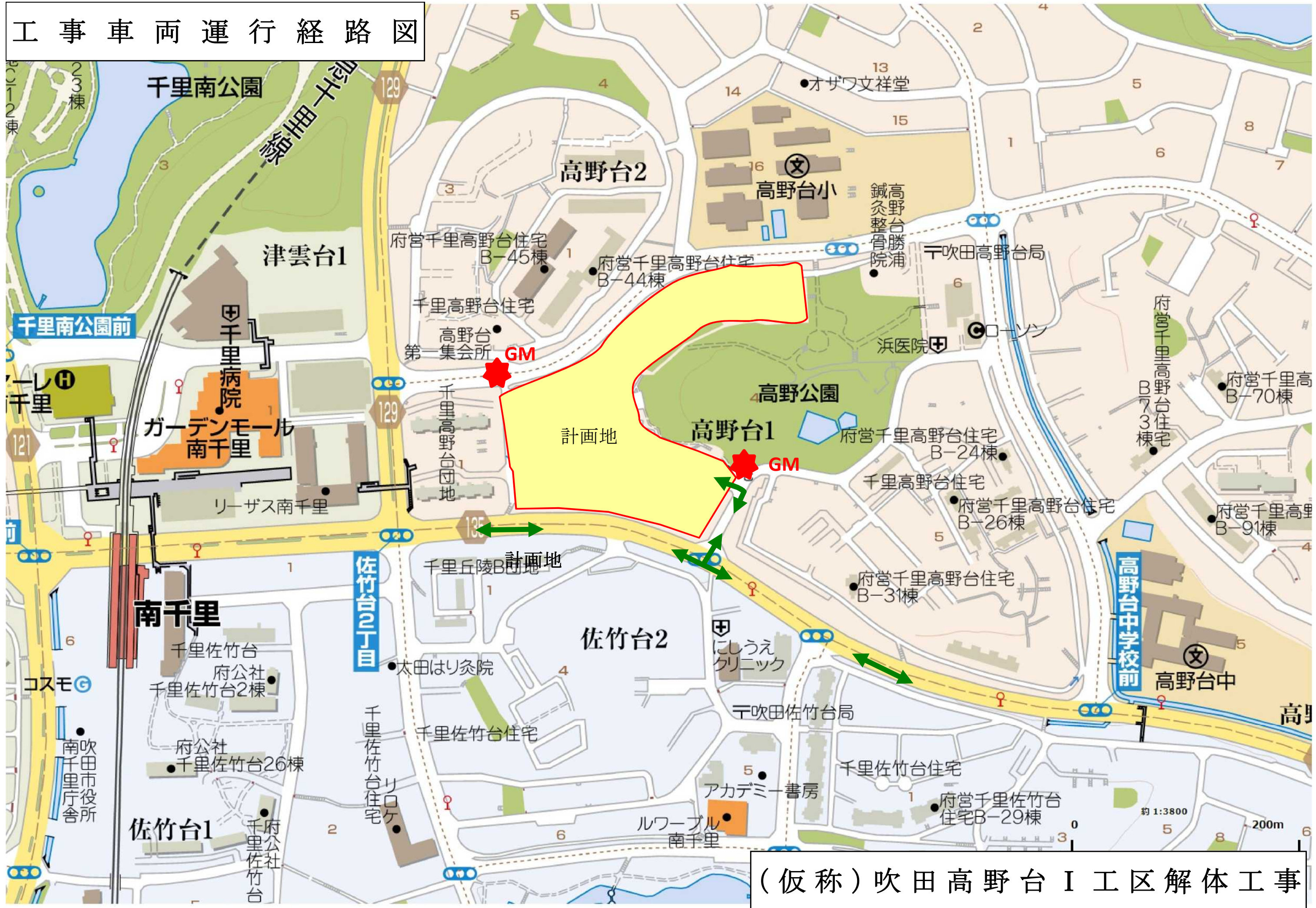
(仮称)吹田高野台 I 工区解体工事