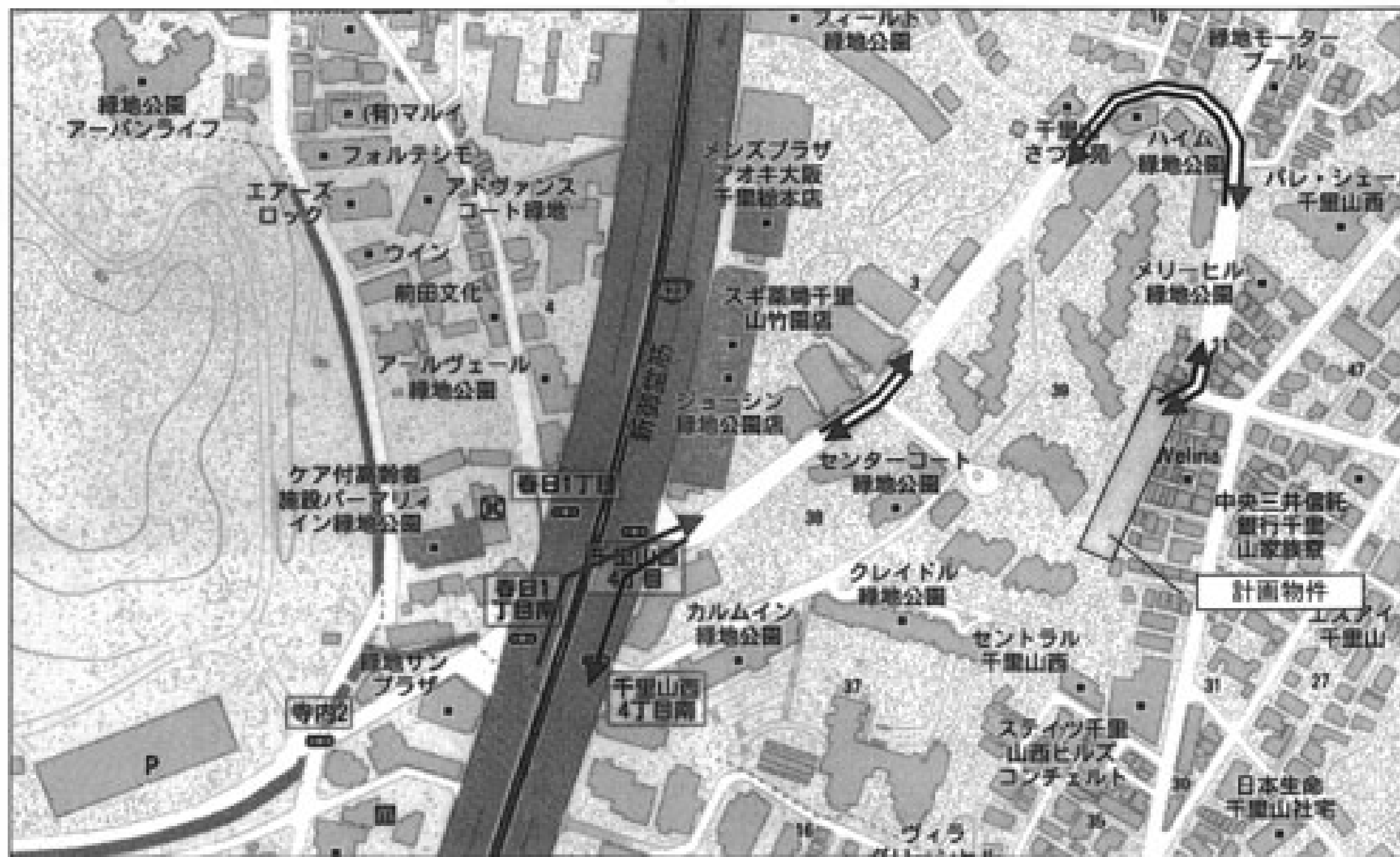
(仮称)グランアッシュ千里山西 新築工事