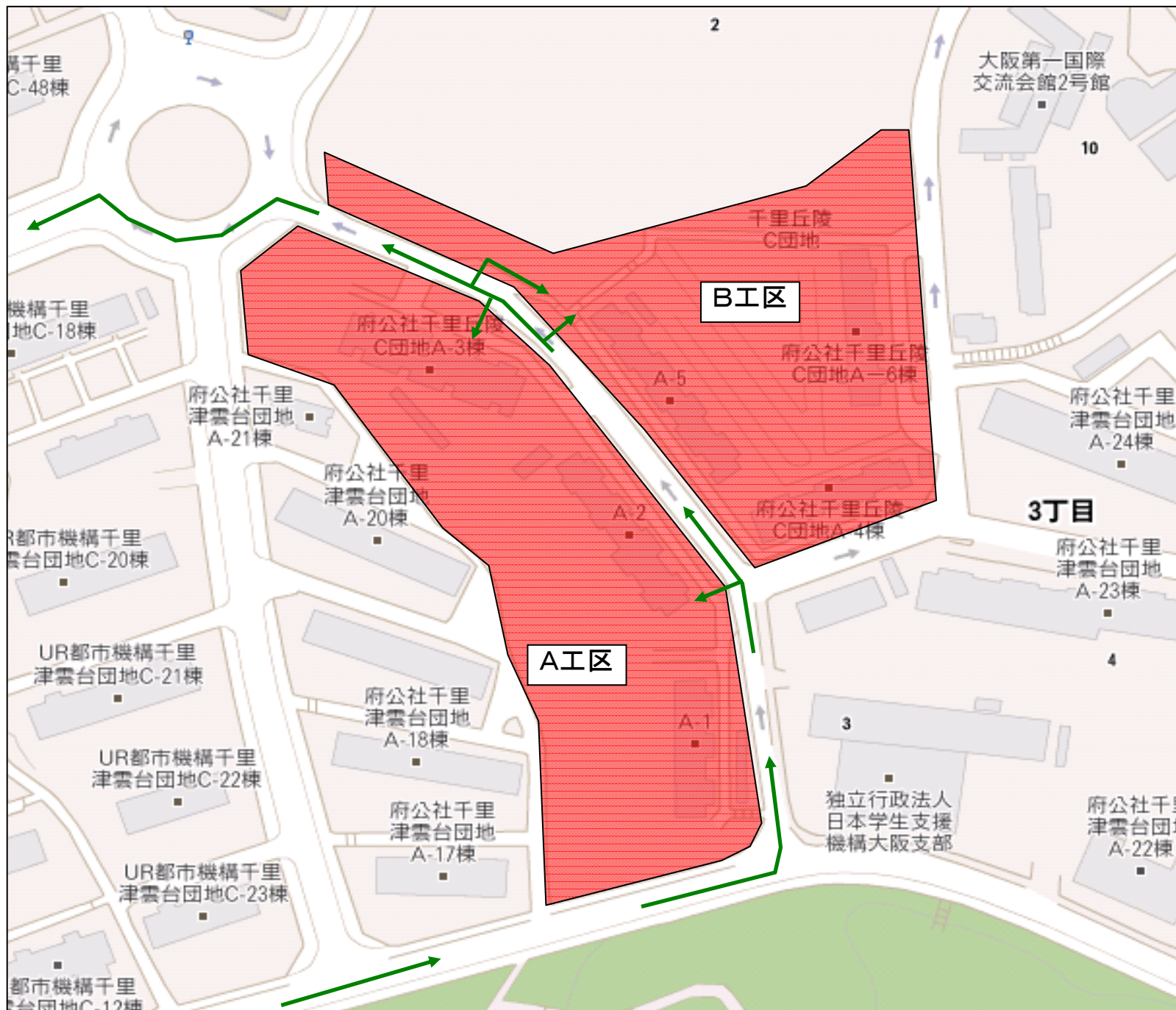
建設工事大型車輛運行経路