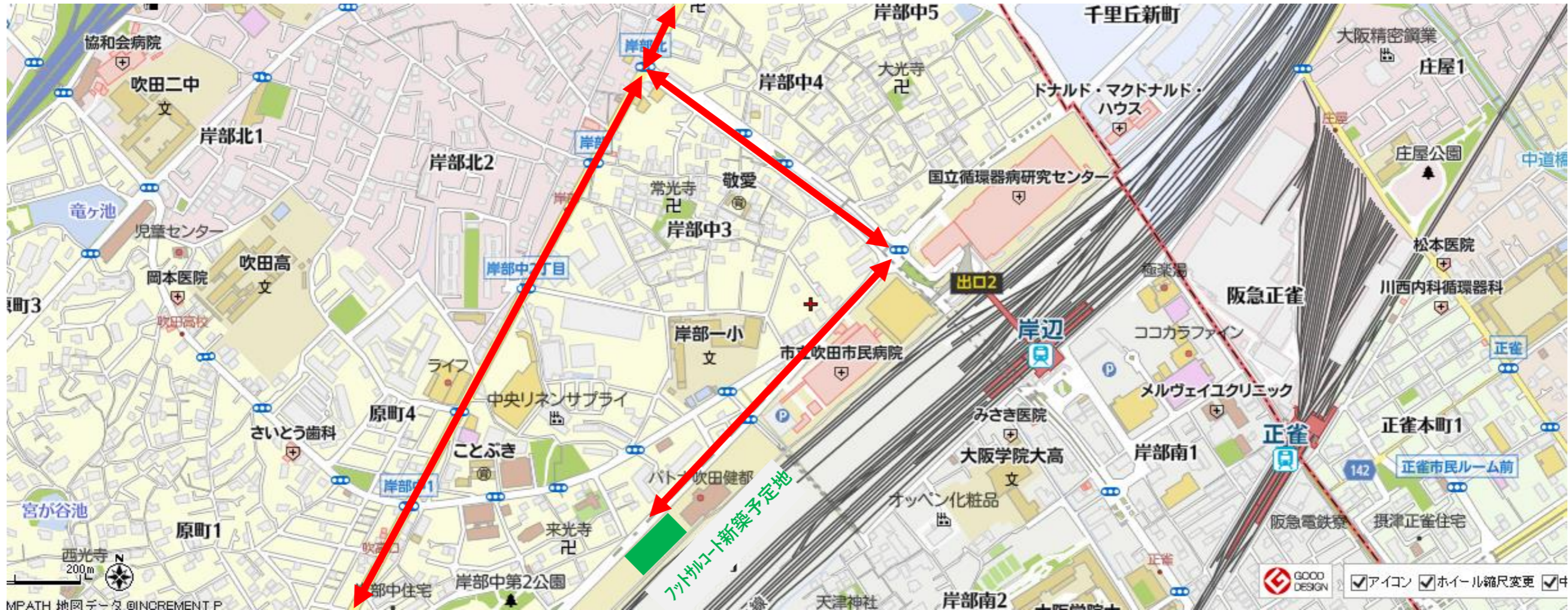
2021年9月現在計画工程