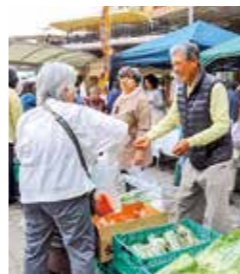
新鮮な地元野菜が並びます

地産地消の取り組みとして、新鮮な旬の地元農産物を販売します。 (3月13日(日)午前9時30分〜11時。売り切れしだい終了。所豊津公園。 (吹田産業フェア) 6384・1373 6384・9909)。