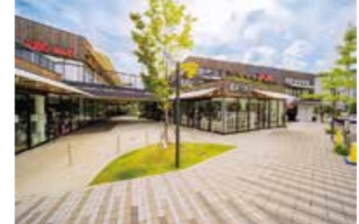
吹田グリーンプレイスのまちなみ