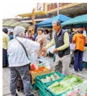
新鮮な地元野菜が並びます

地産地消の取り組みとして、新鮮な旬の地元農産物を販売します。 時2月13日(日)午前9時30分～11時。 売り切れしだい終了。 所豊津公園。 岡地域経済振興室農業担当(☎6384・1373 ☎6368・9909)。