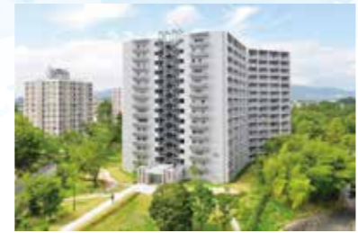
千里グリーンヒルズ竹見台101号棟