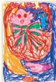
榎原 綾香 6歳