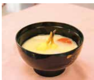
吹田くわいを使った雑煮

くわいを使った雑煮などの料理やデザートを作ります。時12月26日(日)午後1時~4時。所千里金蘭大学。☎市内在住の小学生以上。小学生は保護者同伴。定20人。多数抽選。☎往復はがきに参加者全員の名前と年齢を書いてシタイプロモーション推進室(〒564・8550住所不要☎6318・6371 FAX6384・1292)へ。12月10日(金)必着。