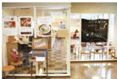
現在営業中のチャレンジショップ

市役所地下1階の店舗スペース「ゆめちか」に飲食店を出店し、経営を学びませんか。個別相談などの支援あり。時4月から約1年間。☎期間終了後、市内で事業を継続する意思のある人。¥月1万2050円。光熱水費や出店・営業に必要な費用は出店者負担。☎12月1日(水)~1月14日(金)に所定の用紙を地域経済振興室(☎6170・2370 FAX6384・1292)へ。