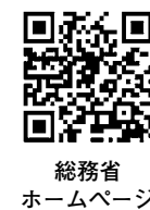
総務省 ホームページ

マイナポイントとは、キャッシュレスで2万円のチャージが買い物をする、1人当たり上限5000円分のポイントが付与されるものです。今年4月末までにマイナンバーカードを申請した人はマイナポイントの申請が可能です。スマートフォンや自宅のパソコン、マイナポイント手続きスポットで申し込み後、利用してください。詳しくは総務省のホームページを確認してください。