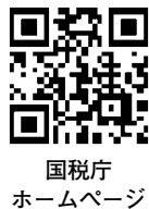
国税庁 ホームページ

令和3年分の確定申告は、国税庁ホームページからe-Tax(パソコン・スマホ申告)を利用してください。申告書の作成が簡単、待ち時間がないなどのメリットがあり、自宅ですぐ作成することができます。e-Taxの利用にはマイナンバーカードか、税務署で発行できるIDとパスワードが必要のため、早めに準備をお願いします。