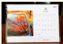
写真は昨年のもので

正解者の中から抽選で3人に、すいかレ2022と図書カードをプレゼントします。はがきに、〇に入るクイズの答え、市報すいたの感想、住所、名前、電話番号を書いて広報課(〒564・8550住所不要)へ。11月19日(金)消印有効。1人1枚。当選者のみ通知します。前回の答え：オレンジ