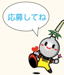
吹田市 イメージキャラクター すいたん

幼児・小学生のイラストや習字を募集。イラストは、はがきサイズの白い紙に描いてください。季節がテーマの作品は2か月前必着。住所、名前(ふりがな)、学校名・学年(幼児は年齢)、電話番号を書いて直接か郵送で広報課(〒564・8550住所不要TEL6384・1276 FAX6384・7887)へ。作品は返却しません。掲載は1人につき年1回。多数選考。