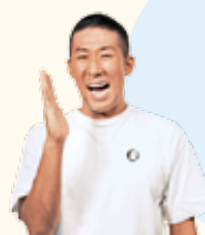
番組MC 田村 裕