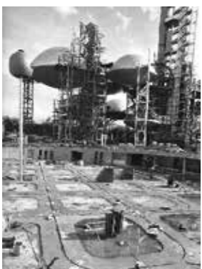
千里丘にて1969年に撮影され たもの

写真家の産木彦彦さんが作品に ついて語ります。時11月27日(出)午 後2時～3時30分。所吹一地区公 民館さんくす分館。対18歳以上。 定先着12人。保あり。要約筆記あ り。申11月1日(月)から直接か電 話、ファックスで、さんくす図書 館へ。手話通訳・要約筆記希望は 11月13日(土)まで。