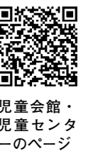
児童会館・ 児童センタ ーのページ

児童会館・児童センターは現在、 規模を縮小して開館しています。 詳しくは各館か子育て政策室(TEL 4860・6947 FAX 6368・7349)へ お問い合わせください。