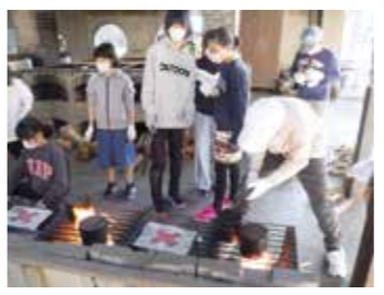
昨年のキャンプの様子

クリスマス料理や防災グッズなどを作ります。時12月4日(出)午前9時～5日(日)午後4時30分。所わくわくの郷。対小学3年～中学生。定15人。多数抽選。¥1800円。交通費実費。申11月14日(日)までに所定の用紙を同センターへ送る。当選者は11月27日(出)午後4時から行つ説明会に参加を。