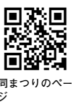
同まつりのページ

SDGs上映会や吹田まち歩きなど、さまざまな多文化交流イベントを実施。時11月1日(月)～30日(火)。日程や場所など詳しくは同まつりホームページへ。