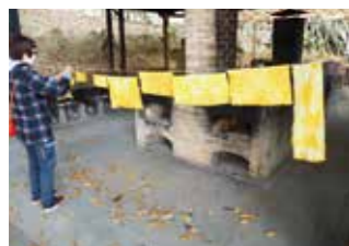
昨年の体験の様子

時12月15日(水)午前10時〜午後4時。対市内在住の人。小学生以下は保護者同伴。定10人。多数抽選。¥1000円。申☆。11月15日(月)必着。