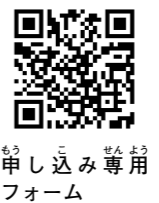
申し込み専用フォーム

「ママの身体と心のケア」と「子どもの命を守る防災教室」を開催。地域で暮らす親同士の交流の場です。時11月17日(水)午前10時～正午。所ラコルタ。対就学前の乳幼児と保護者か、妊娠中の母親。定20人程度。申メールで同協会へ。ホームページからも可。