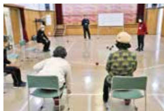
ポッチャを実施している様子

子供から車いすの人まで幅広く楽しめるスポーツです。時11月21日(日)午後1時30分〜3時30分。定先着30人。申11月2日(火)から☆。