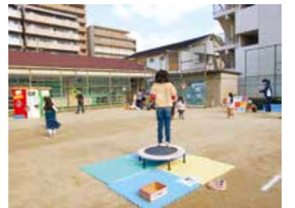
楽しいイベントが盛りだくさん

11月24日(木)に寿町児童センターで「ボーナス チャレンジ大会」を、11月28日(日)に豊一児童セ ンターで「ゲームコーナーあそび」を開催しま す。同寿町児童センター(TEL/FAX 6383・9777)、 豊一児童センター(TEL/FAX 6389・9355)。