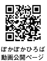
ぽかぽかひろば動画公開ページ

鉛筆の持ち方などの動画を浜屋敷ホームページで公開します。時11月25日(水)から。対おおむね3歳～小学3年生。