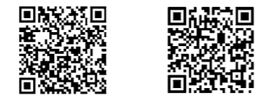
LINEの登録は こちら 使い方や 登録方法について

吹田市公式Twitter @SuitaCity_Osaka 災害情報や緊急情報、 安心安全に関する情報を 発信します。 吹田市公式Facebook @suita.city 市のイベント情報や行政 情報などを発信します。