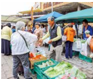
新鮮な地元野菜が並びます

地産地消の取り組みとして、新鮮な旬の地元農産物を販売します。11月14日(日)午前9時30分～11時。売り切れしだい終了。所豊津公園。地域経済振興室農業担当(6384・1373 FAX6368・9909)へ。