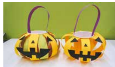
かぼちゃのお菓子バッグ

かぼちゃのお菓子バッグを作り、お菓子をゲットしよう。10月23日(土)、24日(日)午前10時～午後5時に1日6回。所千里丘市民センター。定各先着5人。10月1日(金)～20日(水)に直接か電話で問合せ。写真撮ろう。ロビーにハロウィン仕様のフォトスポットを設置しています。10月23日(土)～31日(日)。