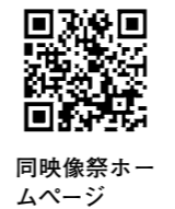
同映像祭ホー ムページ