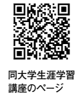
同大学生涯学習 講座のページ