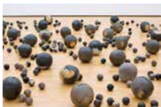
渡辺泰幸作「土の音」