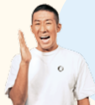
番組MC 田村 裕

今月の前半号は、吹田市役所にあるお弁当屋さんについての特集です。地下1階にある「ゆめちか」というスペースで経営するお弁当屋さんで、飲食店開業をめざすという夢を市役所が応援する場所なんです。ぜひ、みなさんも夢に向かって奮闘する親子を応援してください。