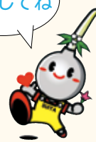
吹田市 イメージキャラクター すいたん