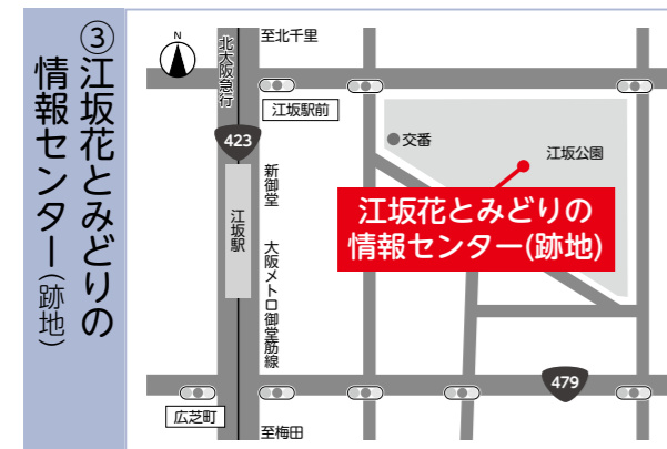
③江坂花とみどりの 情報センター(跡地)