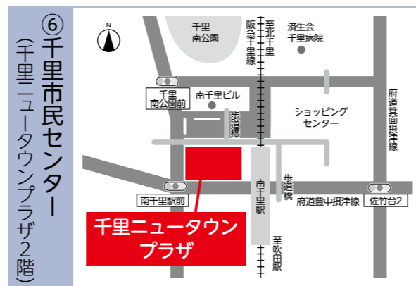
⑥千里市民センター (千里ニュータウンプラザ2階)