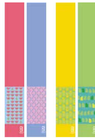
季節ごとに変わるデザインを楽しんでください

市役所を訪れた人に市の魅力や四季を感じてもらおうと、庁舎の外壁にバナーアート(懸垂幕)を展示します。このバナーアートは、若手職員によるプロジェクトチームでコンセプトやデザインを作成しました。4月から。悪天候などにより、取り外している場合があります。シティプロモーション推進室(TEL6318・6371 FAX 6384・1292)。