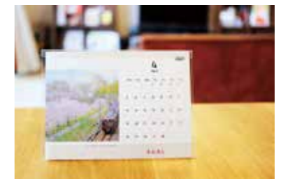
令和3年版の卓上カレンダー

シティプロモーション推進室(TEL6318・6371 FAX6384・1292)。