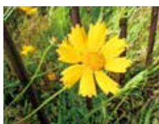
オオキンケイギク 直径5〜7cm 両面に荒い毛が生えている葉の周囲はなめらか 葉は細長くだ円形 葉の一番幅がある部分の幅は1cm程度 葉が対生

認ってください。☎環境政策室(☎63384・1782 FAX63368・9900)。