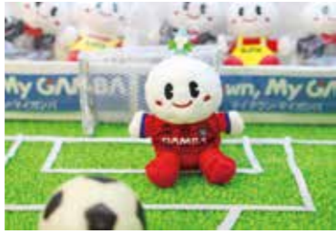
ストラップ型のマスコット

すいたんマスコットを販売 ガンバ大阪の2021シーズンユニフォーム(ゴールキーパー)を着用したすいたんマスコットを販売。限定1000個。無くなりしだい終了。■4月6日(火)から。■シティプロモーション推進室とInforestすいた。■700円。■同室(☎6318・6371 FAX6384・1292)。