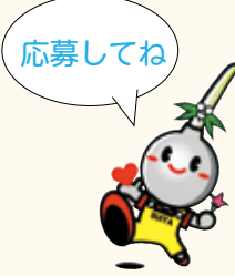
吹田市 イメージキャラクター すいたん