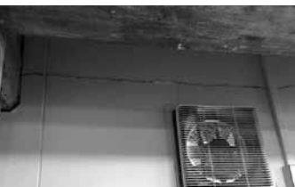
北千里市民プール壁面の亀裂