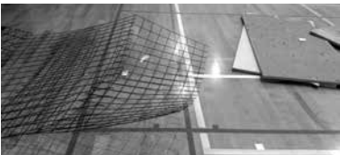
北千里市民体育館の天井材の落下