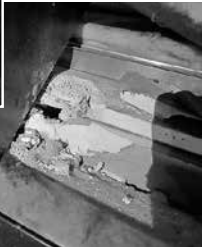
大ホール天井内の部材のゆがみ・亀裂