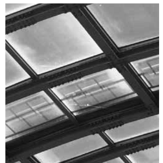
片山市民プール 可動式天井のガラスの割れ

各所にひび割れなどの損傷があるため、室外プールの今シーズンの利用は中止します。修繕工事を急ぎ、来シーズンの利用再開をめざします。なお、片山市民プールの室内プールは早期の再開をめざします。