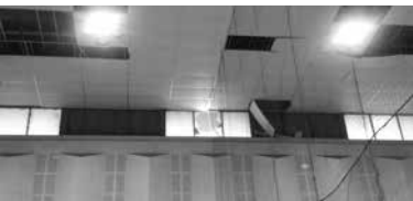
北千里市民体育館の天井

とさらなる良質な文化芸術空間を再現するための取り組みであることをご理解ください。平成29年度に1年間休館して行った改修工事は、「舞台装置」や「内装」などの改修を行ったもので、耐震改修ではありませんでした。