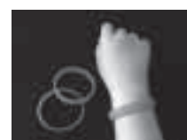
受講者には認知症の人を応援するオレンジリングを呈呈

祉センター (TEL6317・5461 FAX6317・5469)、(2)は佐竹台・高野台地域包括支援センター (TEL6871・2203 FAX6871・2276)、(3)は千里山西地域包括支援センター (TEL6310・8060 FAX6310・8561)へ。