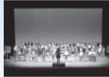
過去の舞台発表の様子

◇認定こども園吹田南幼稚園◇吹田第一小学校わかば学級◇片山小学校ダンスクラブ◇豊津中学校演劇部◇ぷくぷくワールド