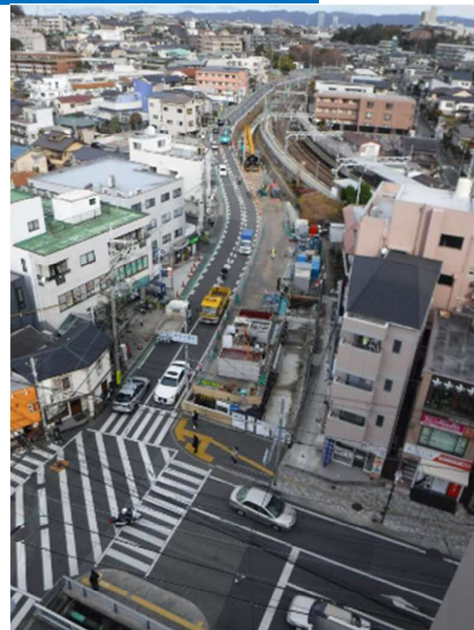
整備イメージ図（全体）