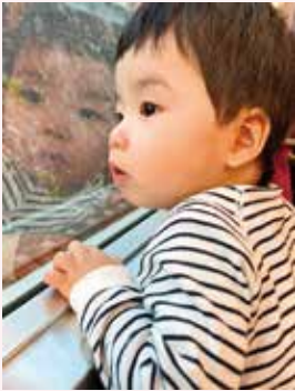
流れる景色に夢中

1歳を過ぎて電車に興味津々の息子。通り過ぎる建物や自然に目をキラキラさせて大興奮。もうすぐ色づき始める紅葉の時期に電車に乗るのが楽しみです。