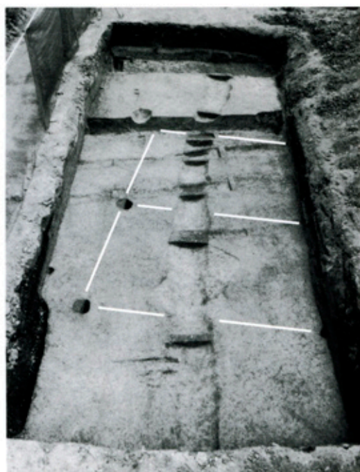
▲東側の調査区で発見された溝と建物跡

今回の発掘では、他に縄文時代の石鏃、5世紀前半と6世紀後半の須恵器も出土しました。当遺跡の周辺の遺跡でも、同じ頃の遺構・遺物が出土しており、昭和町一帯にはこれらの時代の遺跡が広範囲に分布していると考えられます。