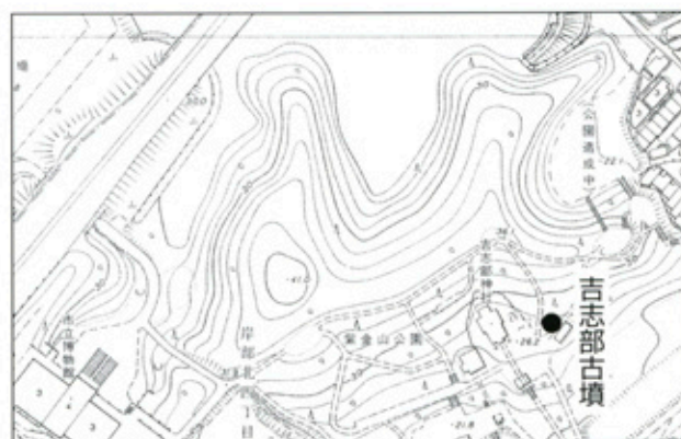
▲吉志部古墳位置図