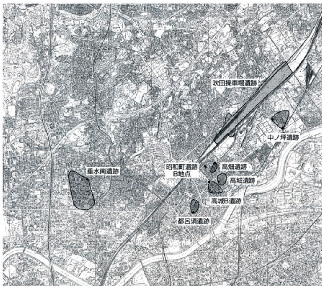
▲新たに範囲の拡大した遺跡

吹田市では、遺跡周辺地において開発等の工事が計画された場合、必要に応じて試掘調査を実施しております。そして、試掘調査によって、毎年数件の遺跡が新たに発見されています。ここでは、平成10年度と平成11年度に発見された遺跡について紹介します。