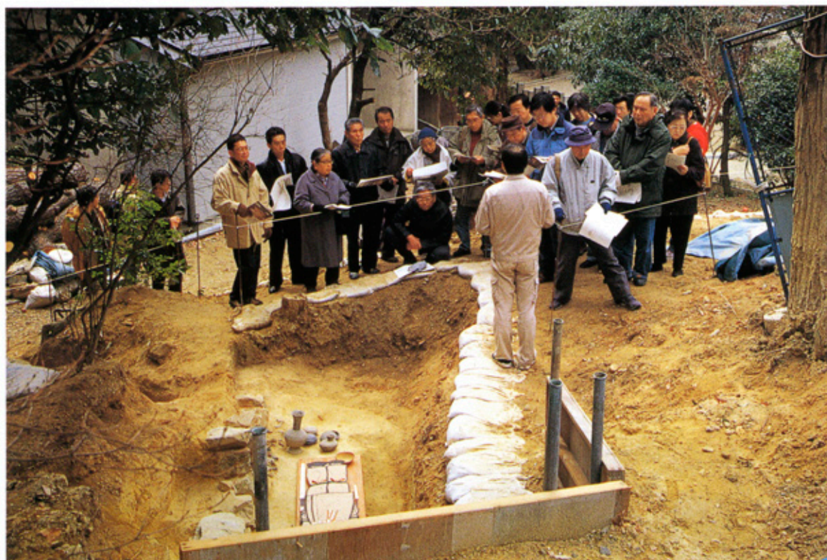
▲吉志部古墳 現地説明会風景

平成12年1月から2月にかけて、吉志部古墳 きしべこふん において発掘調査を実施しました。昭和47年 せきしつ 以来の再調査で、吹田市内で石室の現存が確認されている唯一の古墳として、今後、その保存と整備を図ることを目的として実施したものです。