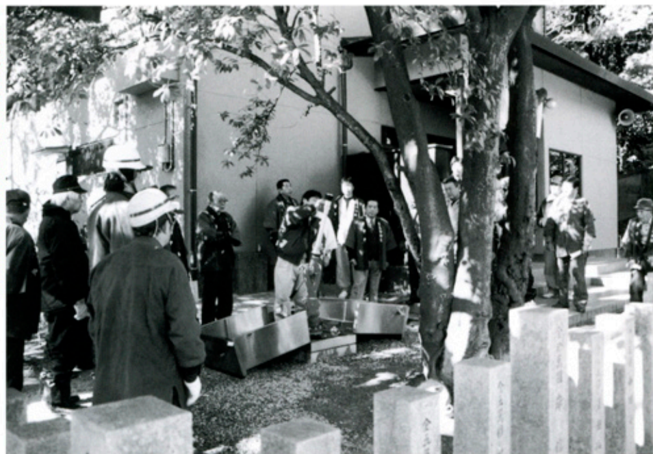
▶吉志部神社での自衛消防隊による防災訓練

吉志部神社本殿を含めて、我が国の重要文化財に指定された建造物の大半は木造建築であることから、これらの歴史的な建造物を守っていく上では、特に火災に対して十分に注意することが必要です。そのため、文化庁や大阪府教育委員会の指導を受けて、貴重な文化財である神社本殿を火災から守るために自動火災報知設備及び放水銃等の消火設備が設置されました。