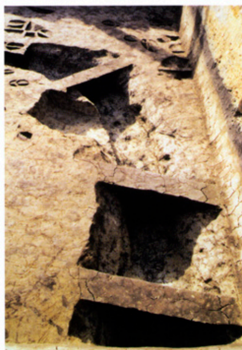
▶周溝状の溝近景（東から）