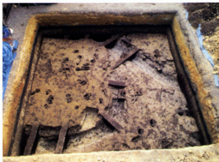
▲今回発見された弥生～古墳時代の遺構

調査地からは、この他にも古墳時代のピット・足跡と、まっすぐ伸びる溝がみつかりました。溝については、幅約113～120cm、深さ34.9～42.6cm、方位N76°36'Wで、溝内からは甕や高