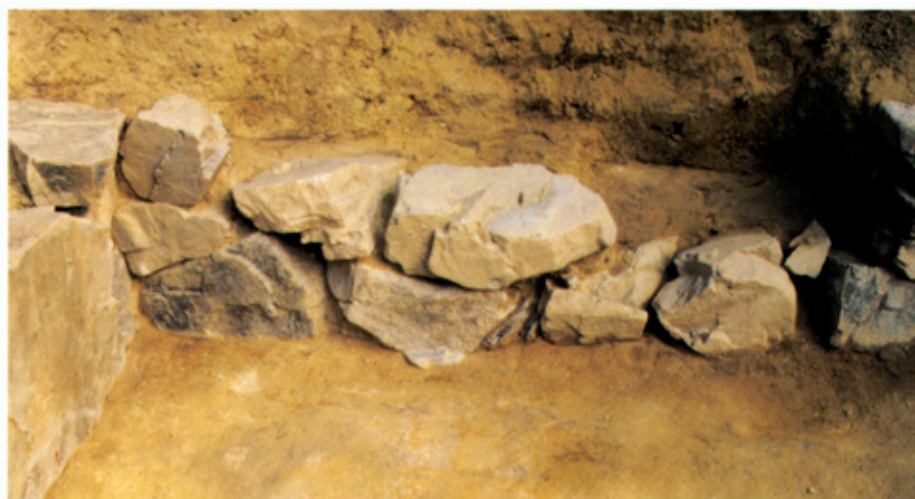
▲横穴式石室 東側壁

れた立地にあること、畿内では一般に古墳の新たな築造が少なくなる7世紀前半の古墳であること、主体部が無袖式横穴式石室であること、出土遺物の内容から、終末期群集墳（小規模な古墳が狭い範囲に密集して築かれた群集墳のうち、7世紀に入り新たに墓造りを始めるもの）を構成する古墳であり、そのうち、初めの時期に築かれたものと考えられます。