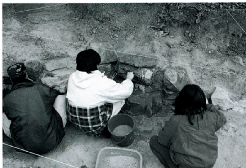
吉志部古墳 調査風景

平成11年度、吹田市におきましては垂水遺跡、高畑遺跡、高城遺跡、中ノ坪遺跡、高城B遺跡、吉志部古墳の6遺跡において発掘調査を実施しました。