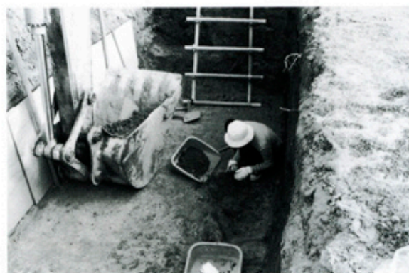
▲高城遺跡 調査風景

吉志部古墳の発掘調査は昭和47年以來の再調査で、その保存・整備を目的に実施したものです。