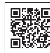
地方税共同機構ホームページ